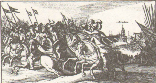
Die den spangj ert goet vertrouwt. Siet hier waer op dat hy bouwt.