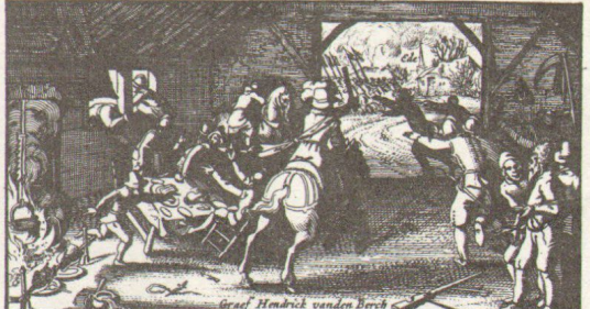
De Vlucht tot Ede. van Gf Hendrick en syn volck